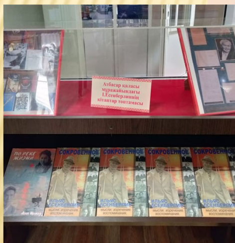
І.Есенберлиннің кітаптар топтамасы