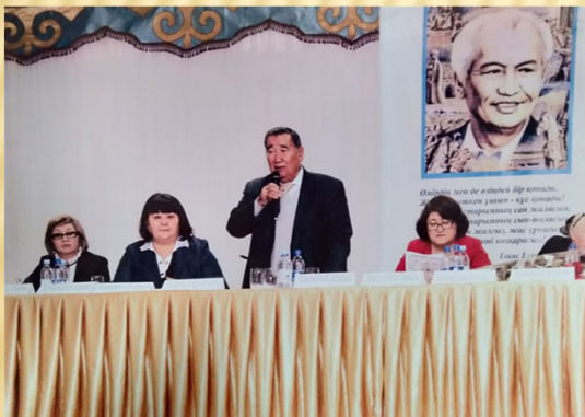
2011 жыл желтоқсан

2017 ж. Елбасы Н.А. Назарбаевтың «Болашаққа бағдар: рухани жаңғыру» бағдарламасын іске асыруда мұражай қоры жазушының тарихи шығармаларымен толықтырып, қайта жаңғыртылды.